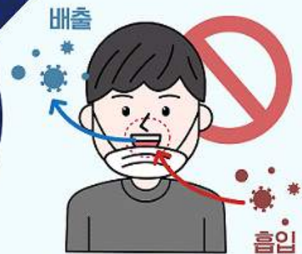
② 턱에 걸치는 마스크 착용