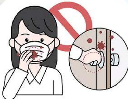
③ 마스크 겉면을 만지는 행위