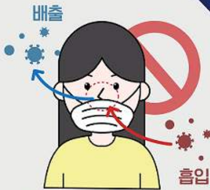
① 코가 노출되는 마스크 착용